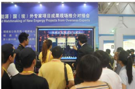
“6.18”国（境）外专家项目成果现场推介对接会现场，电子黑板演示

2012年第十届中国海峡项目成果交易会拉开了序幕（简称“6·18”），今年福建省科协有多项引进海外智力的成果在“6·18”精彩亮相。